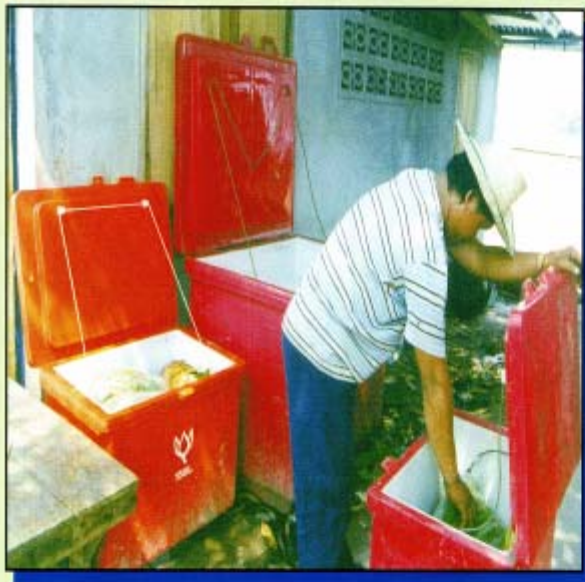
ถังแช่อาหาร

3. ควรมีการวางแผนการใช้คนตัดอ้อยให้เหมาะสมกับลำดับการตัดอ้อยที่ได้รับ เพื่อให้คนตัดอ้อยมีงานทำตลอดฤดูกาลเก็บเกี่ยวอ้อย นอกจากนี้การรับส่งคนตัดอ้อยให้ถึงแปลงแต่เช้าจะช่วยให้นักตัดอ้อยสามารถตัดอ้อยได้มากขึ้น