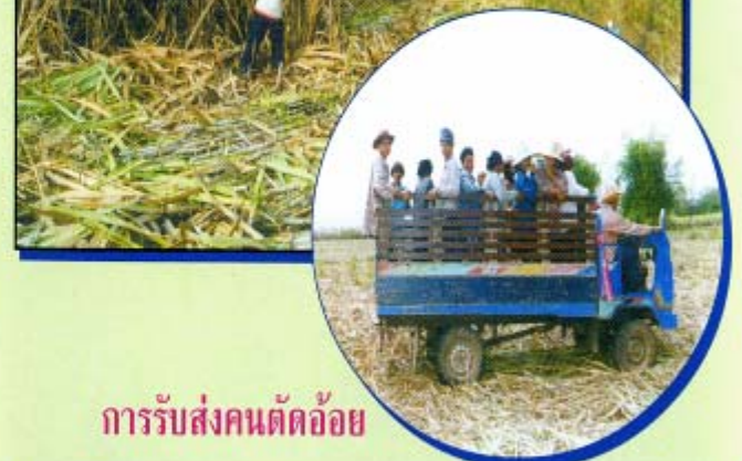
การรับส่งคนตัดอ้อย