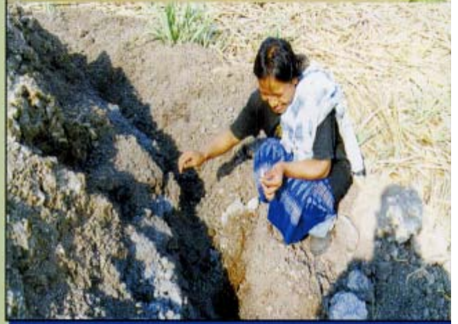
ที่พักถาวร และแหล่งอาหาร