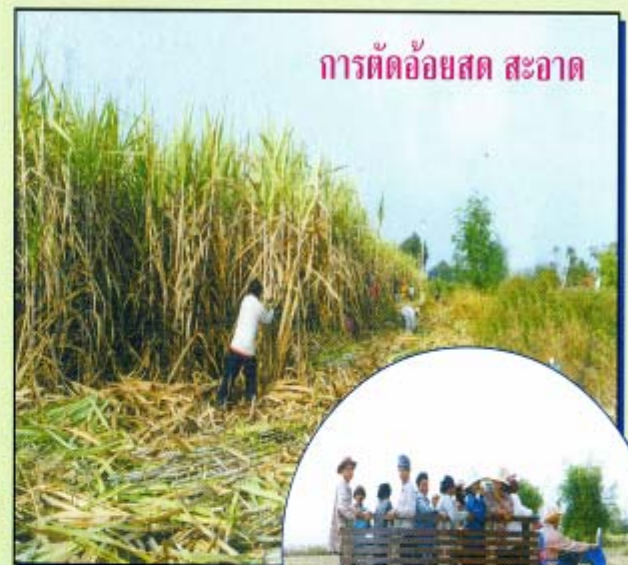
การตัดอ้อยสด สะอาด

หมายเหตุ : ราคาอ้อยเบื้องต้น 500 บาท, ค่าความหวานที่ 14 ซีซีเอส