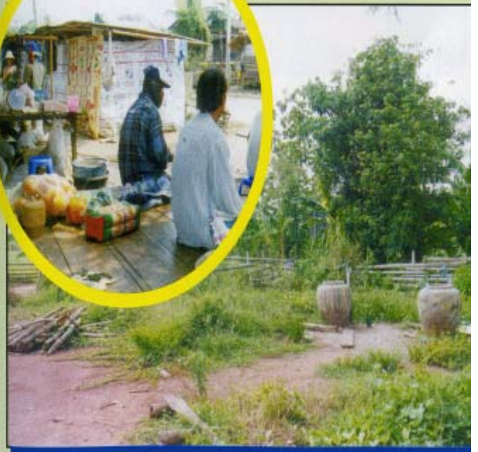
ไฟฟ้า และน้ำประปา